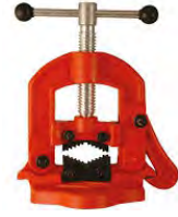
MORSA PARA CAÑO