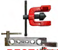
PESTAÑADORA PARA CAÑO