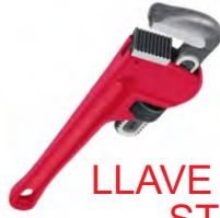
LLAVE CAÑO STILSON