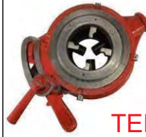
TERRAJA PARA CAÑO