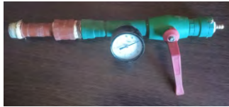
MANÓMETRO DE PRESIÓN